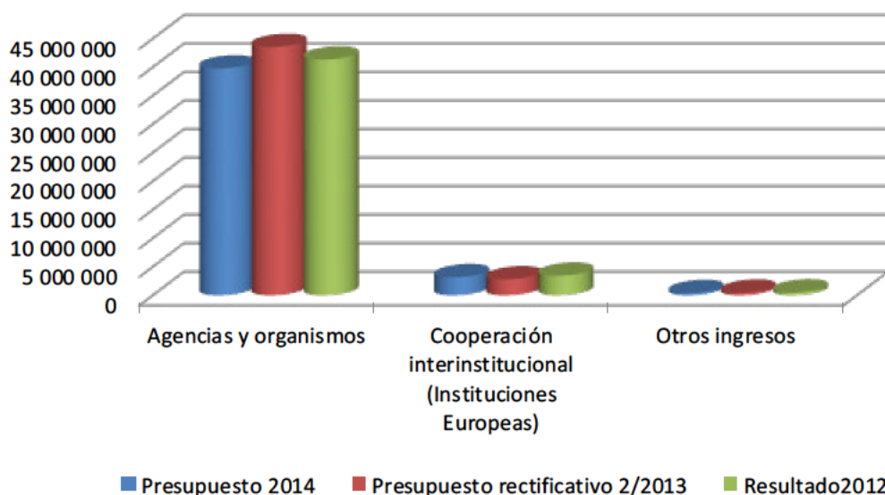
Gráfico 1. Ingresos por título y ejercicio, 2012-2014 (Títulos 1, 3 y 4)