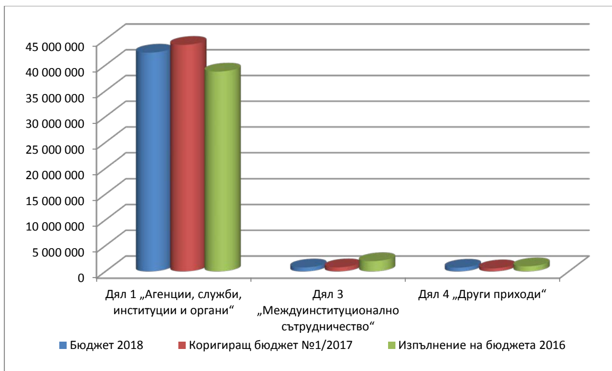
Фигура 1. Приходи в разбивка по дялове* и години: 2016—2018 г. (дялове 1, 3 и 4)

* От 2017 г. всички приходи от възложителите на Центъра за предоставянето на езикови услуги се записват в дял 1. До 2016 г. приходите от институциите на ЕС за предоставянето на езикови услуги бяха записвани в дял 3.