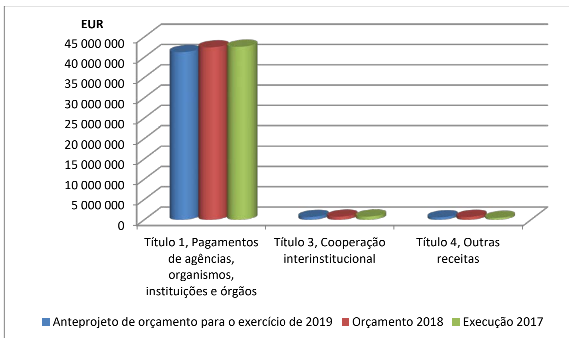
Figura 1. Receitas repartidas por título* e exercício financeiro: 2017-2019 (títulos 1, 3 e 4)

As receitas do Título 3 correspondem às receitas que o Centro recebe na qualidade de entidade responsável pela gestão da base de dados interativa de terminologia IATE («Inter-Active Terminology for Europe»). As despesas do Centro com a base de dados IATE são inscritas no Capítulo 31 (Despesas).