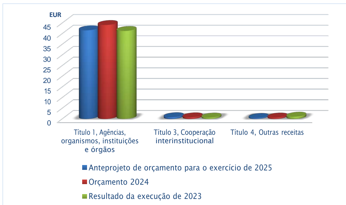
Figura 1. Receitas repartidas por título e exercício financeiro: 2022-2025 (Títulos 1, 3 e 4)

Além das receitas provenientes dos seus clientes e da cooperação interinstitucional, o Centro prevê receitas adicionais no Título 4, principalmente: juros bancários; receita proveniente dos serviços de alojamento do centro de dados prestados à ERA (Agência Ferroviária da União Europeia); e uma contribuição financeira do Governo luxemburguês para apoio das despesas de arrendamento dos escritórios do Centro. A previsão para estas receitas em 2025 é de 516 200 EUR, ou seja, menos 27,1 % do que o orçamento de 2024 e menos 53,2 % do que o resultado de 2023.