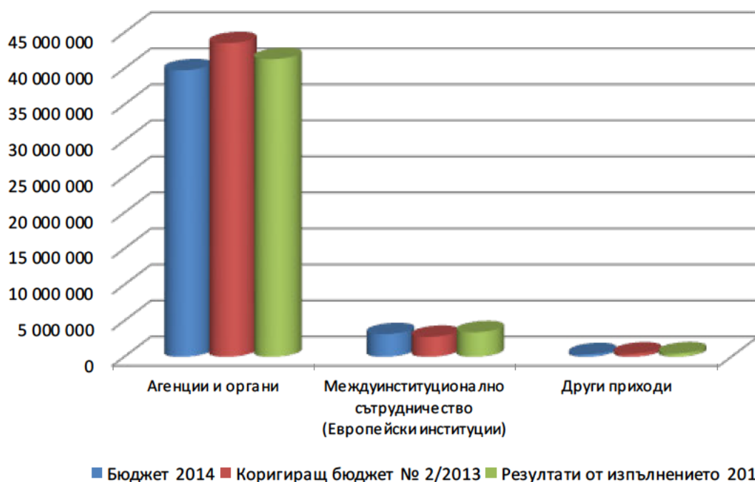
Схема 1. Приходи по дялове и години, 2012-2014г. (Дялове 1, 3 и 4)

Подобно на предходни години, Центърът отправи искане към своите възложители да предоставят прогнози за 2014 г. Прогнозите бяха изготвени въз основа на новите тарифи за 2014 г., които по онова време бяха предварителни. Следва да се отбележи, че много възложители изтъкнаха неточността на прогнозите си, като основната причина е, че към момента на прогнозиране работните им програми за 2014 г. все още са били във фаза на планиране. Въз основа на информацията от възложителите прогнозните приходи в Дялове 1 и 3 възлизат на 42,9 милиона евро, което е с 3,48 милиона евро (7,44%) по-малко от бюджета за 2013 г. По оценки ефектът от промяната в тарифите, изчислен въз основа на прогнозите от 22-мата възложители, които предоставиха подробни прогнози за обемите, ще се изрази в намаление на приходите с поне 1,7 милиона евро. Другото намаление се дължи главно на по-малките обеми марки на Общността и терминологични списъци, прогнозирани от ONIM.