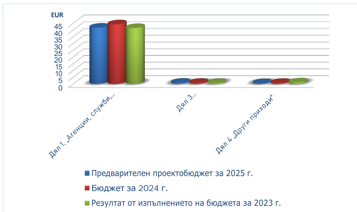
Фигура 1. Приходи в разбивка по дялове и години: 2023—2025 г. (дялове 1, 3 и 4)

В допълнение към приходите от възложители и междуинституционално сътрудничество Центърът прогнозира допълнителни приходи по дял 4, главно под формата на банкови лихви, приходи от хостинг на услуги, свързани с център за данни, които Центърът предоставя на ERA („Агенцията за железопътен транспорт на Европейския съюз“), и финансова вноска от правителството на Люксембург за разходите на Центъра за наем на офиси. Прогнозата за тези приходи през 2025 г. възлиза на 516 200 EUR, което е с 27,1 % по-малко в сравнение с бюджета за 2024 г. и с 53,2 % по-малко от изпълнението на бюджета за 2023 г.