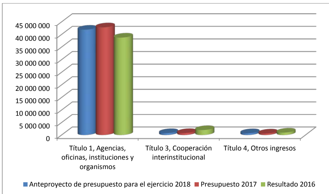
Gráfico 1. Ingresos desglosados por título* y año: 2016-2018 (Títulos 1, 3 y 4)

*A partir de 2017, todos los ingresos de los clientes del Centro se consignarán en el Título 1. En 2016, los ingresos de las instituciones de la UE se consignaron en el Título 3.